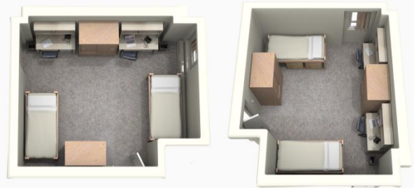
Résidence conventionnelle – Chambre double