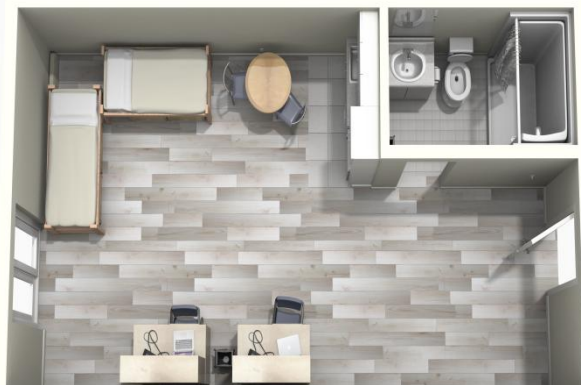
Résidence Friel – Studios